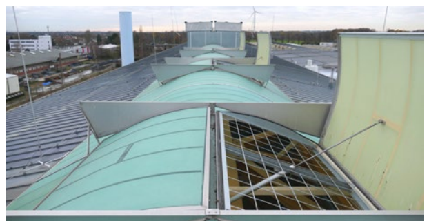
GRILLODUR® DSG in einer Doppelklappe

Mit der entsprechenden Zertifizierung gemäß GS-BAU-18, erfüllt die GRILLODUR® DSG-Durchsturzsisicherung die hohen Anforderungen der Berufsgenossenschaft der Bauwirtschaft.