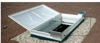
RWA-Lichtkuppel mit Windeitführungen zur Optimierung des aerodynamischen Wirkungsgrades