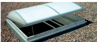
VARIO Lichtklappe mit RWA-Beschlag und E-Motoren in Lüftungsstellung